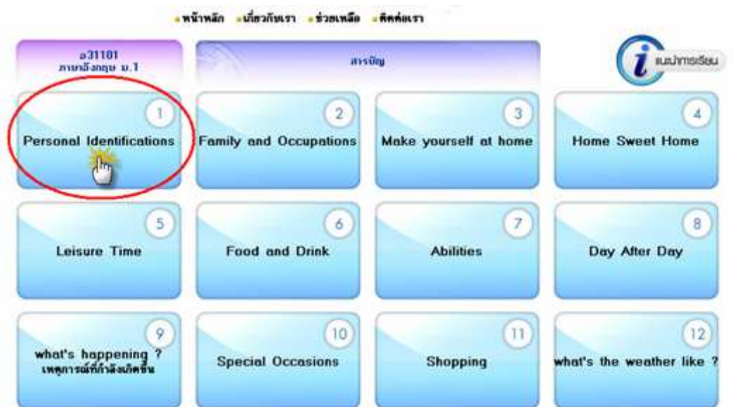
รูปแสดงสารบัญหน่วยการเรียนรู้