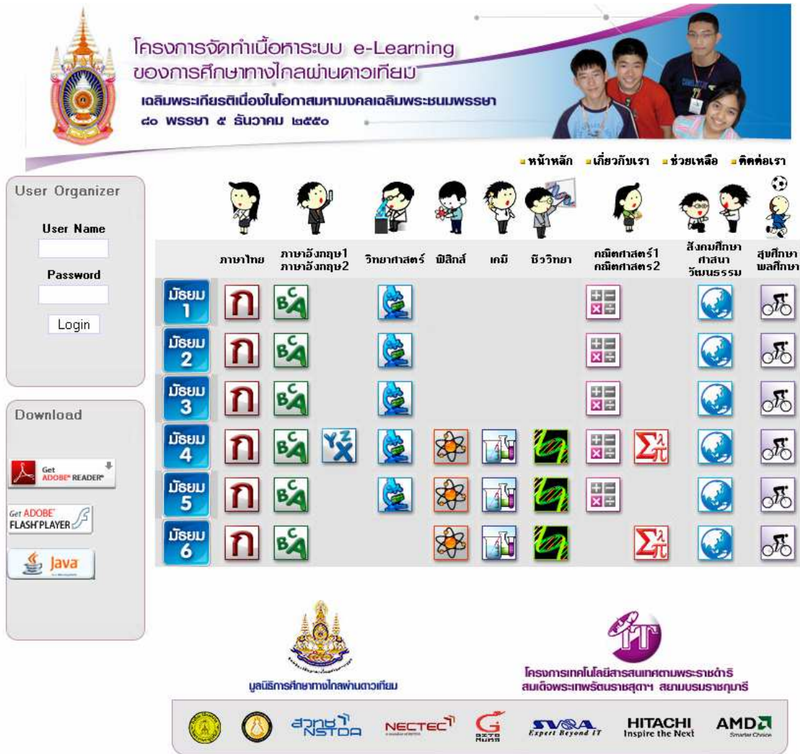
รูปแสดงหน้าหลักของเว็บไซต์

ที่หน้าหลักของเว็บไซต์ระบบ e-Learning ของการศึกษาทางไกลผ่านดาวเทียม (eDLTV) เราจะเห็นหน้าจอแสดงสาระการเรียนรู้ทั้งหมดที่โครงการจัดทำขึ้น โดยเป็นเนื้อหาในระดับชั้นมัธยมศึกษา ดังรูป